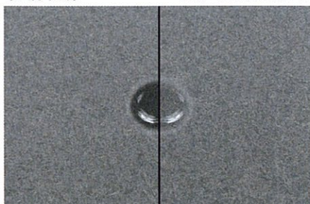
〈水滴下時〉 石種：インド産ミカゲ石

処理後の外観変化が少なく、天然石材独特の素材感を保ちます フッ素効果で汚れの浸透を防止します